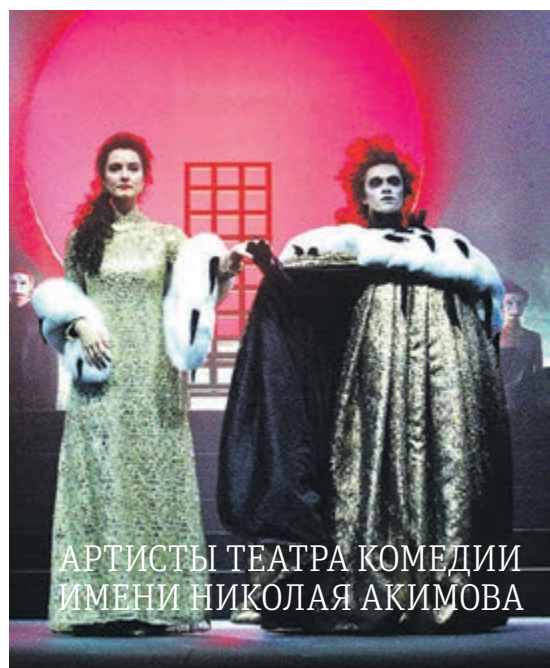
Артисты театра комедии имени Николая Акимова

Молодые лауреаты уходили в этот вечер со сцены с букетами и дипломами, а вместе с ними – с ощущением, что впереди у них не просто длинный путь в профессии, а настоящий новый виток жизни, на который они выходят вместе с городом.