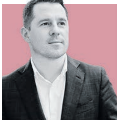
ФЕДОР БОЛТИН, председатель Комитета по культуре Санкт-Петербурга