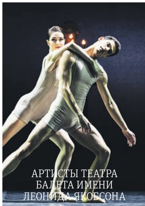
Артисты театра балета имени Леонида Якобсона