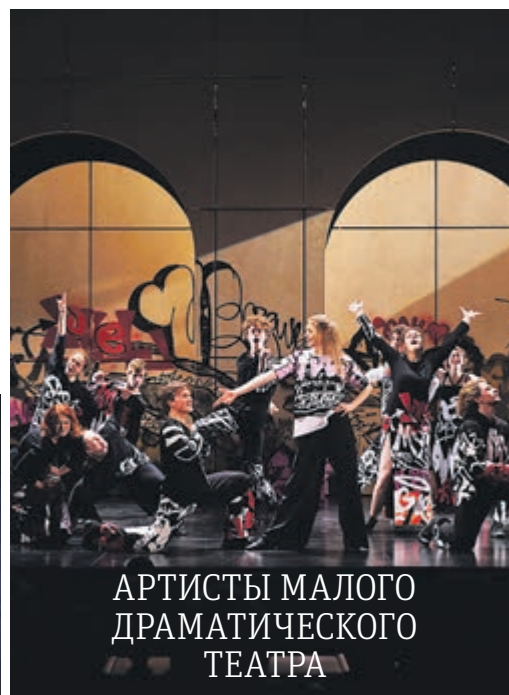
Артисты Малого драматического театра